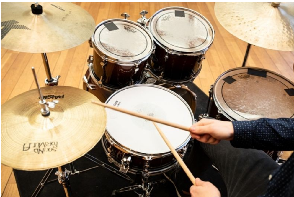
Unser Instrument des Jahres 2022: Schlagzeug im Fokus

10 Bassdrums und über 125 Becken - das größte Schlagzeug der Welt wurde 2020 in Essen gebaut. Mit über 1.000 Teilen ist es aktueller Weltrekordhalter. Neun Stunden lang bauten fünf Musiker und Techniker an dem Konstrukt.