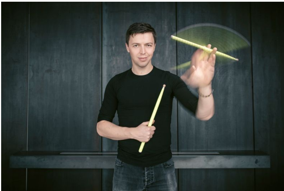
Martin Grubingers Repertoire reicht von solistischen Werken über kammermusikalische Programme mit seinem Percussive Planet Ensemble bis hin zu Solokonzerten.

Versuchen Sie, sechs Drumsticks gleichzeitig in den Händen zu halten. Klappt das? Nun führen Sie jeden Stick individuell. Martin Grubinger kann das. Der Multiperkussionist aus Salzburg ist unser Schirmherr für das Instrument des Jahres 2022 .