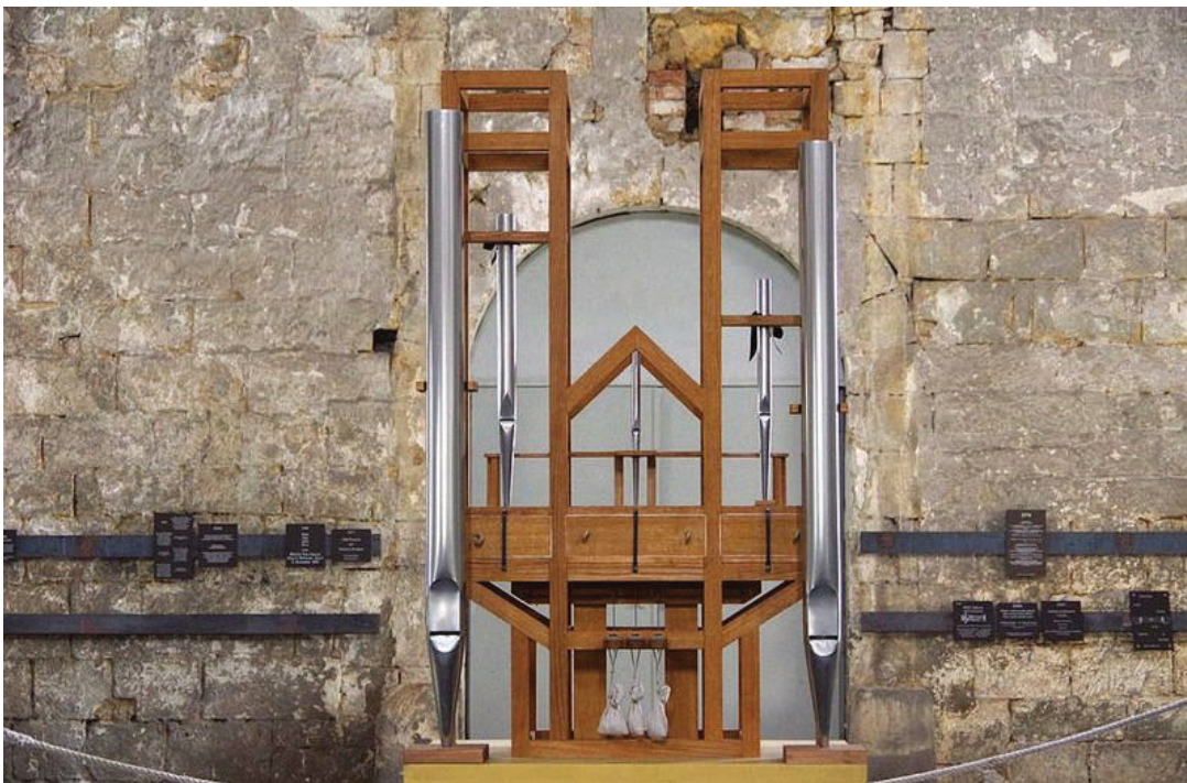
Eine Orgel, die alle paar Jahre mit den Klängen der Partitur wächst: Das John-Cage-Organ-Kunst-Projekt Halberstadt.

Der Schlussston soll im Jahr 2639 erklingen. Bis dahin wächst die Orgel mit ASLSP. Diese Komposition von John Cage ist das langsamste Orgelstück, das die Welt kennt. Alle paar Jahre erwarten Fans in Halberstadt den nächsten Klang. Am 5. Februar ist es wieder so weit.