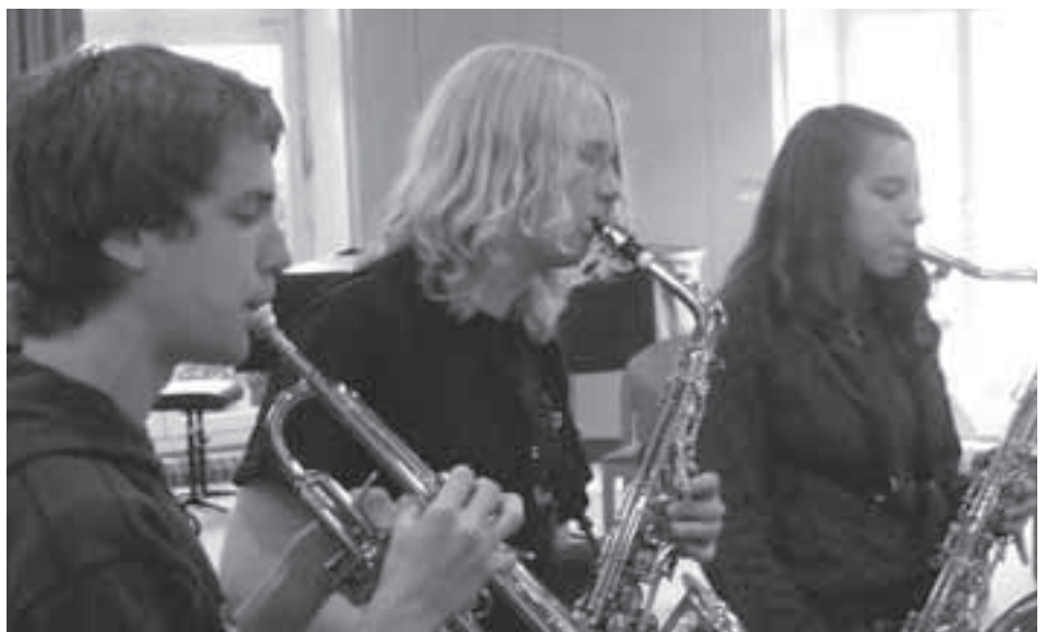
Teilnehmer des SommerJazz 2008