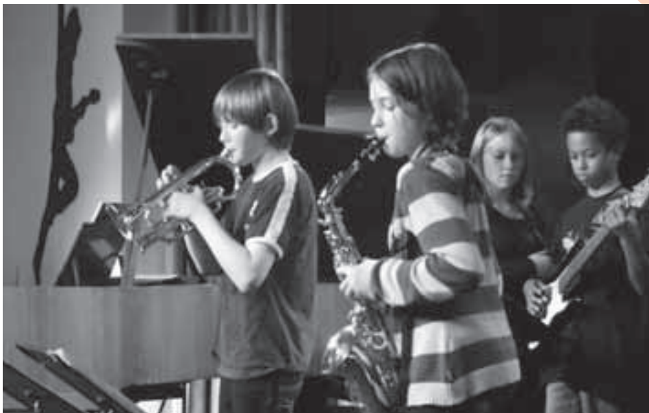
Die jüngsten Teilnehmer des Wettbewerbs: Föhr Young Lions