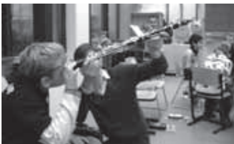
Außergewöhnliche Einblicke in die Klarinette