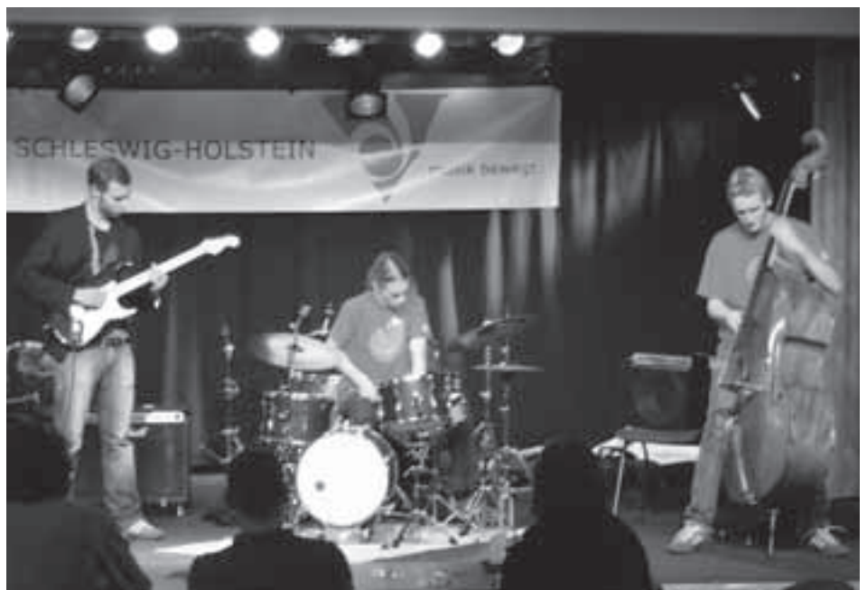
Die dänische Band „Sine Nomine“ beim Landeswettbewerb Jazz-it-up! in Husum

Auch die deutsch-dänische Blechbläserakademie hat bereits eine mehrjährige Tradition – während des Festivals Grenzklang gegründet, wurde sie zunächst meh-