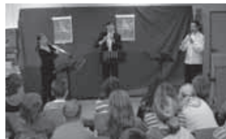
Klassenkonzert einmal anders: Lübecker Klarinettenstudenten beim Schulprojekt in Mölln

zu erhöhen, sondern darüber hinaus auch die musikalischen Institutionen Schleswig-Holsteins zu vernetzen: So haben sich Konzertveranstalter, Musikhochschule und Universität, Musikvereine, Aus- und Fortbildungsinstitutionen sowie Schulen und Musikschulen in das Projekt eingebracht und die Vielfältigkeit des Instruments Klarinette aufgezeigt.