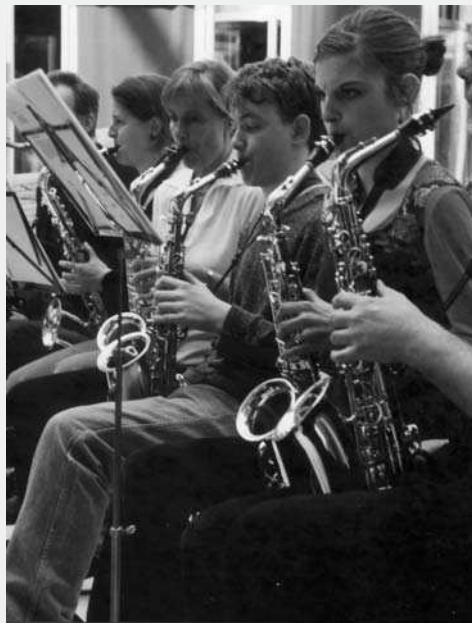
Konzert im Sophienhof

Mit einem außergewöhnlichen Konzert für Saxophonorchester wurden die Ergebnisse des Workshops am Pfingstmontag, den 16. Mai im Sophienhof Kiel präsentiert.